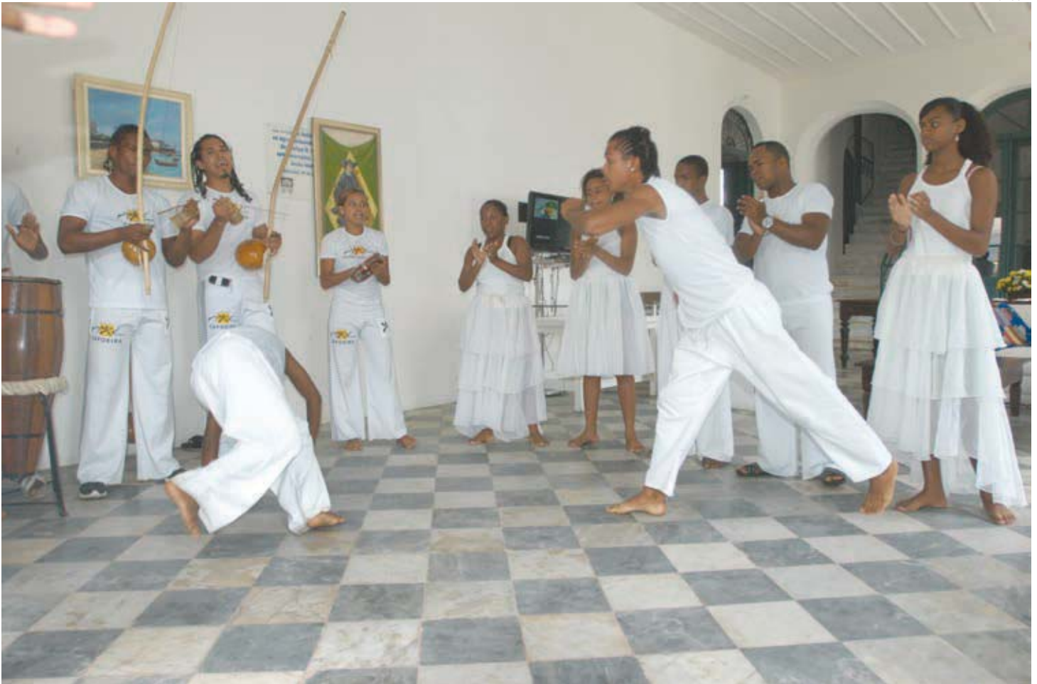
A programação do festival conta com oficinas, mesa-redonda e mostra de filmes sobre a capoeira, reunindo educadores, estudantes, pesquisadores e adeptos da arte/luta