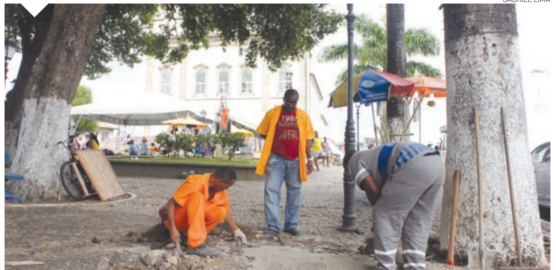
A Desal está recuperando o calçamento em pedras portuguesas, pintura da balaustrada na Colina Sagrada e troca de meio-fio

seios em todo o percurso do cortejo. Também foi feita a retirada de tocos de árvores na Avenida Dendezeiros, com utilização de destocador e retroescavadeira. A Companhia de Desenvolvimento Urbano do Salvador (Desal) está com equipes trabalhando no largo e imediações da