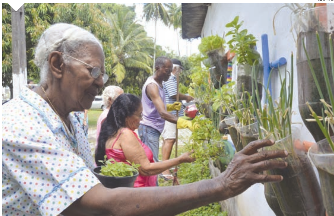
O Abrigo D. Pedro II, que atende 72 idosos, será beneficiado com a compra de equipamentos e material hospitalar

assumiria a secretaria responsável pela manutenção do Abrigo D. Pedro II e dos Cras. Felizmente, o MDS entendeu a importância dos projetos e as emendas foram aprovadas”.