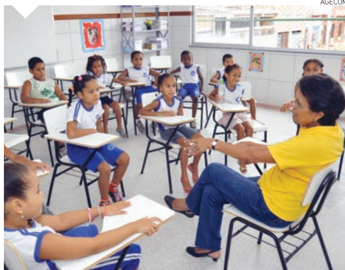
Mais de 170 mil alunos deverão ser matriculados este ano nas escolas do município

Os estudantes do 2º e 3º ano poderão se matricular amanhã, enquanto os dos 4º e 5º deverão garantir sua efetivação na rede municipal de ensino nos dias 10 e 13. No dia 14, será realizada a matrícula para estudantes do 6º ao 9º ano. Já no dia 15, a secretaria finaliza o processo de matrículas de 2014, com os alunos do Programa de Educação para Jovens e Adultos.