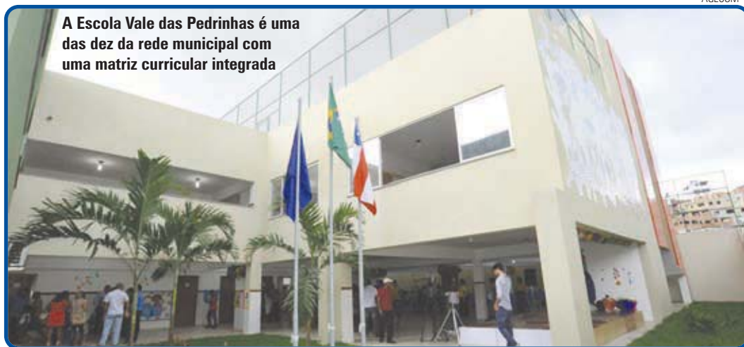
A Escola Vale das Pedrinhas é uma das dez da rede municipal com uma matriz curricular integrada

Este ano foi assinado, por meio de chamamento público, 43 convênios com creches comunitárias e filantrópicas, 13 a mais do que em 2012. A iniciativa também visa ampliação do atendimento à educação infantil. Além da maior oferta de vagas em creches públicas, será ampliado o número de creches conveniadas, aumentando cada vez mais o atendimento às crianças com até três anos.