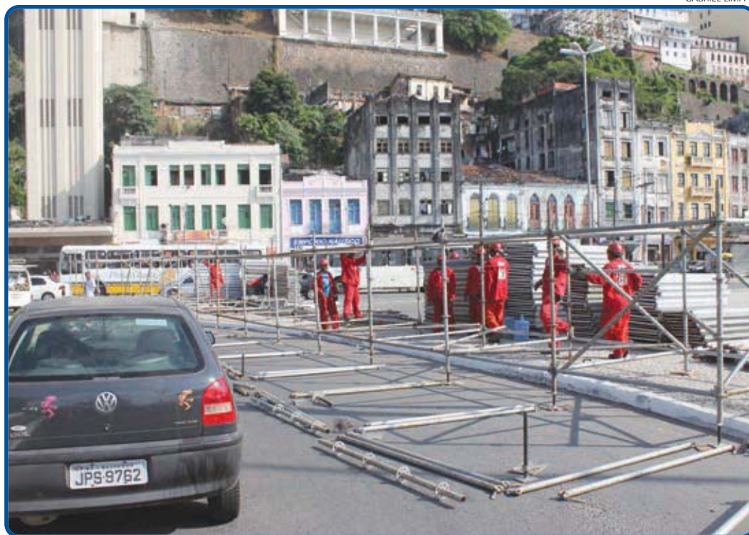
Palco está sendo montado na Praça Cayru, onde subirão grandes estrelas da Música Popular Brasileira