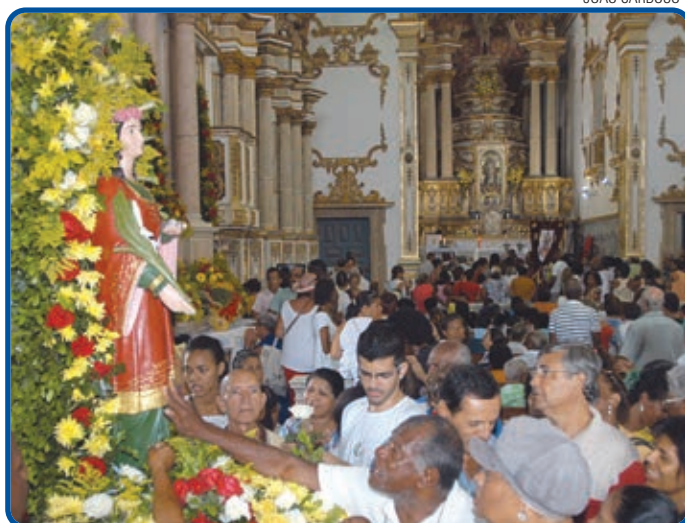
Missas e procissão fazem parte das homenagens à Protetora dos Olhos