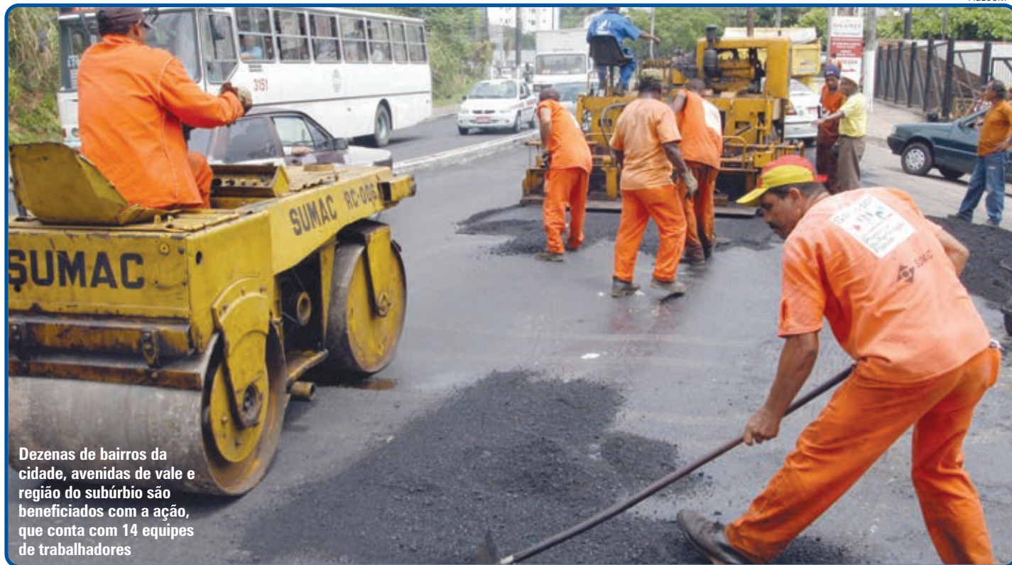
Dezenas de bairros da cidade, avenidas de vale e região do subúrbio são beneficiados com a ação, que conta com 14 equipes de trabalhadores