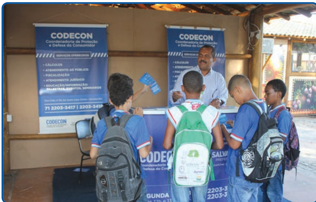
Quem visita o estande recebe informações sobre as atividades da autarquia em defesa do consumidor