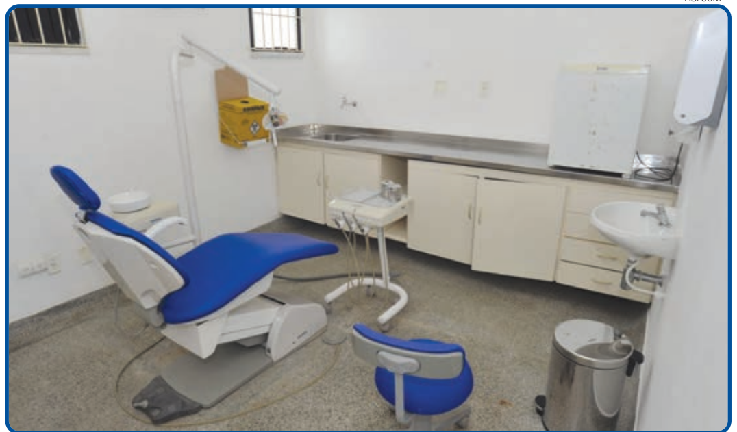
Modernizada e equipada, a USF de Cajazeiras oferece serviços de atenção integral da família e saúde bucal