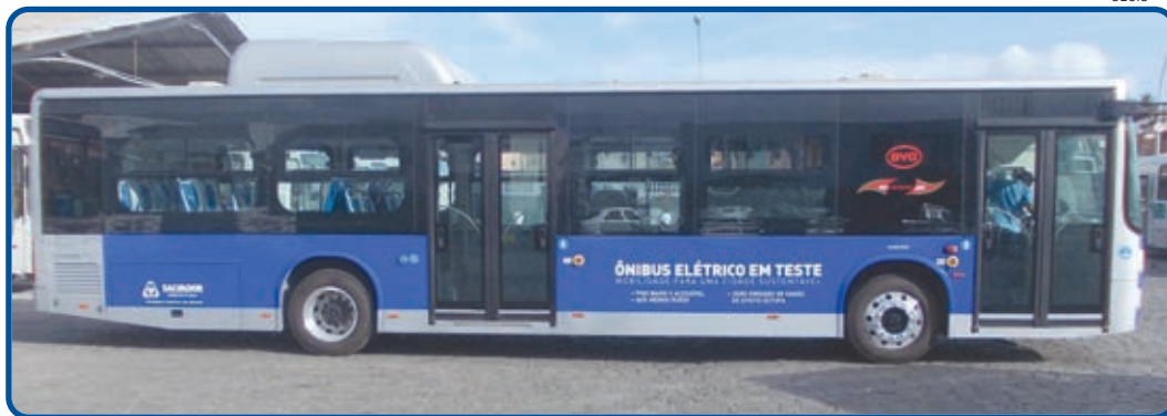
Silencioso e não poluente, o ônibus chega a Salvador para apresentar um novo modal de transporte público urbano