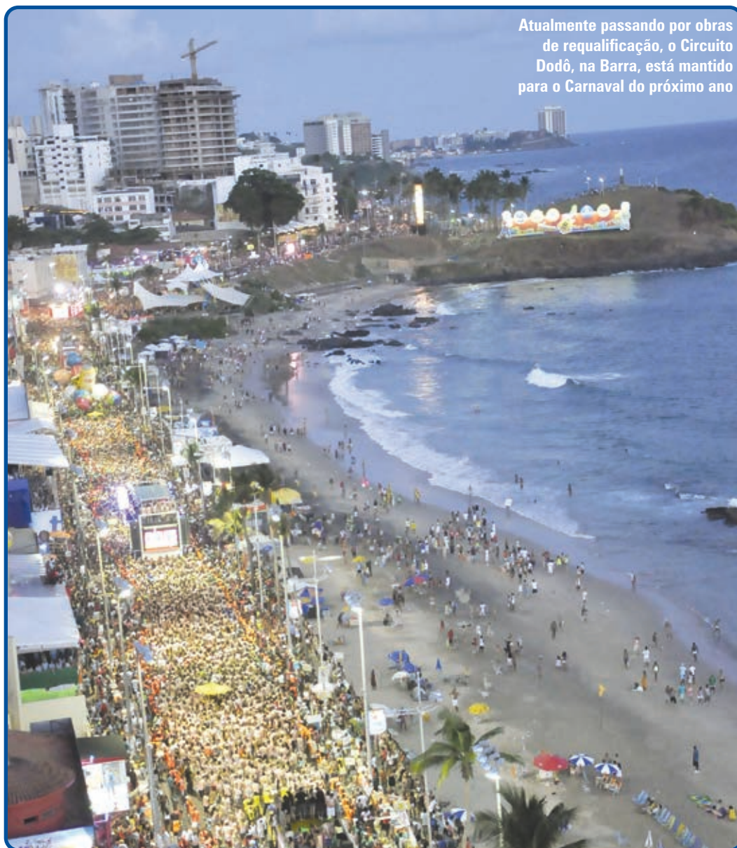
Atualmente passando por obras de requalificação, o Circuito Dodô, na Barra, está mantido para o Carnaval do próximo ano

Também foi apresentada a manutenção do Circuito Dodô, na Barra, que passa atualmente por obras de requalificação. Já para o Carnaval nos bairros, o orçamento foi duplicado, garantindo uma grade de programação mais atrativa, de acordo com a característica de cada comunidade. A festa acontecerá na Liberdade, em Plataforma, Periperi, Cajazeiras, Itapuã, Piatã e Boca do Rio.