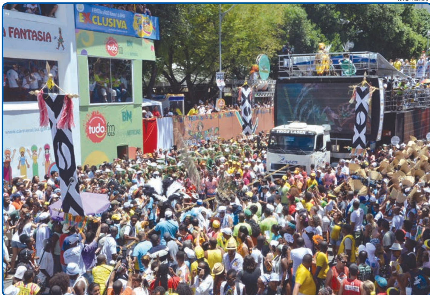
Um dos mais tradicionais circuitos da festa, o Campo Grande arrasta multidões em busca da variedade de atrações que desfilam no local