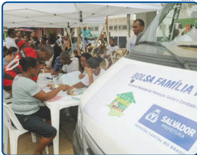
O Bolsa Família Móvel já esteve em 131 comunidades de Salvador

Desde que foi lançado em janeiro deste ano, no Bairro da Paz, o Bolsa Família Móvel tem conseguido cum-