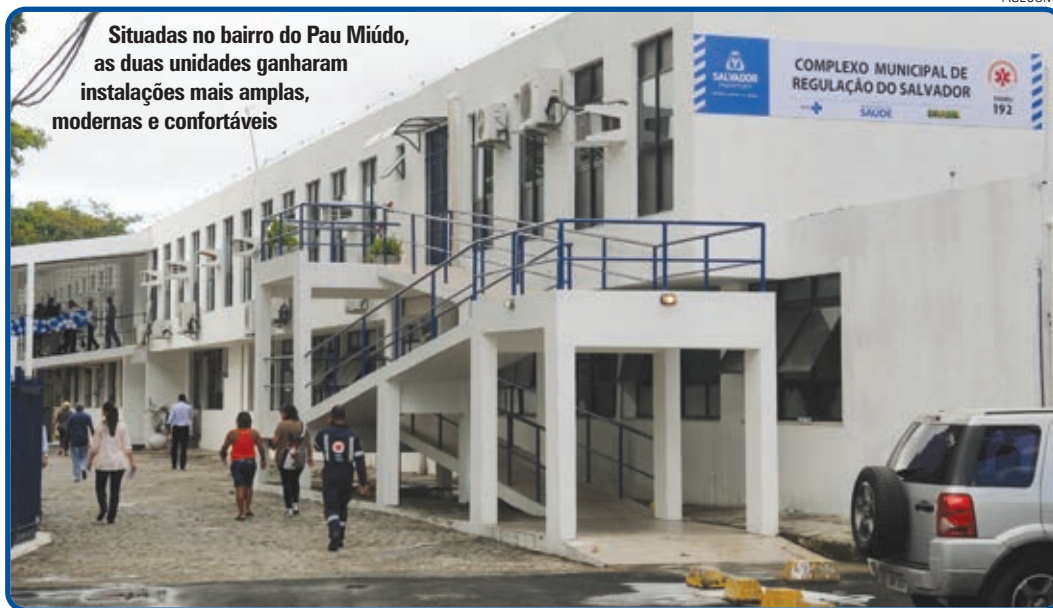
Situadas no bairro do Pau Miúdo, as duas unidades ganharam instalações mais amplas, modernas e confortáveis