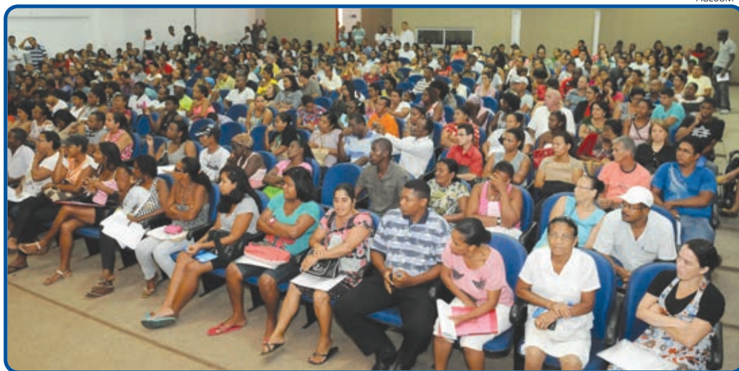
Convocados foram contemplados no sorteio do programa Minha Casa, Minha Vida, no dia 29 do mês passado