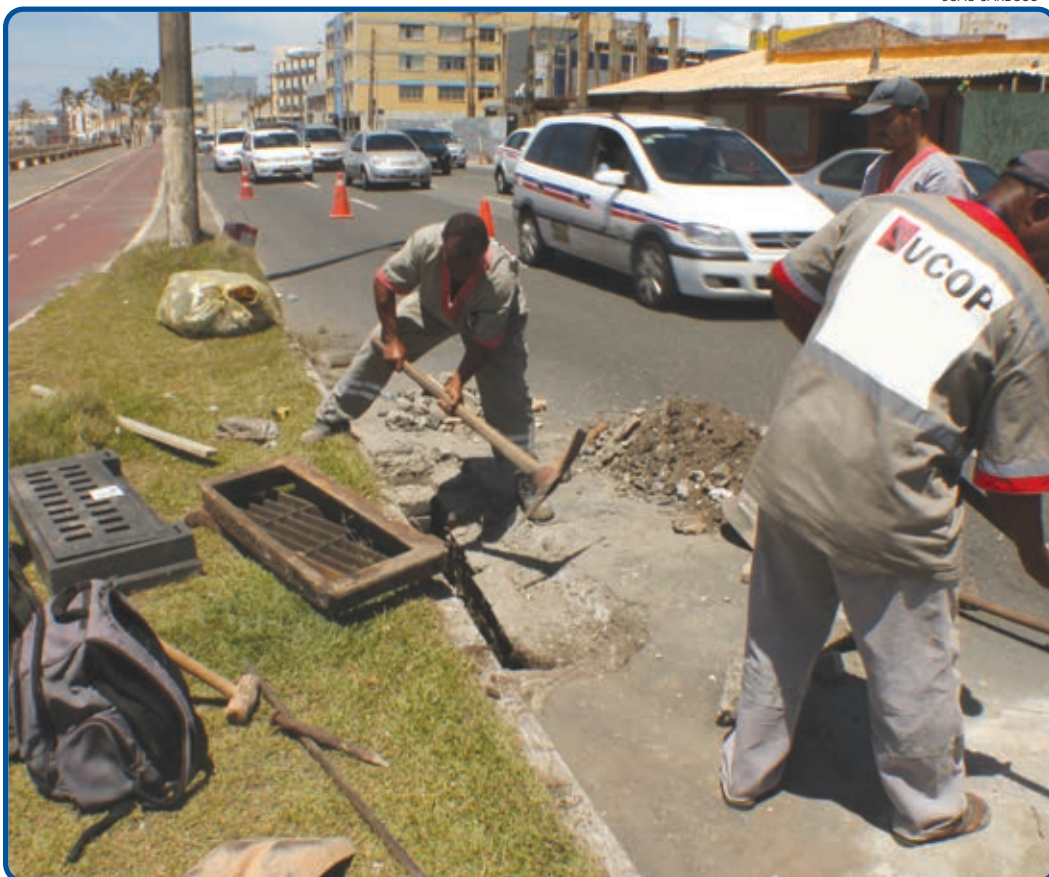
A depender do resultado, a Prefeitura trocará as bocas de lobo e tampões de boca de visitação da cidade