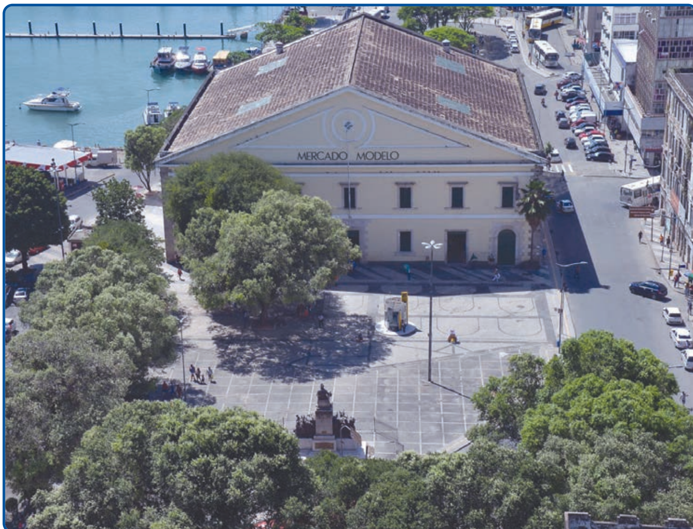
A nova área facilitará a circulação de pedestres, devido a integração entre os espaços existentes com a esplanada em frente e a calçada que circunda o mar