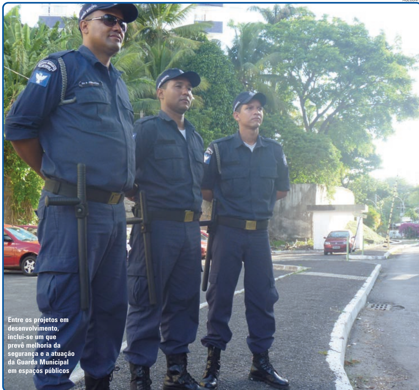
Entre os projetos em desenvolvimento, inclui-se um que prevê melhoria da segurança e a atuação da Guarda Municipal em espaços públicos