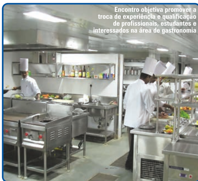
Encontro objetiva promover a troca de experiência e qualificação de profissionais, estudantes e interessados na área de gastronomia

O objetivo do encontro é divulgar a culinária de origem africana que já exerce forte influência na cultura baiana, assim como promover a troca de experiência e qualificação de profissionais, estudantes e interessados na área de gastronomia. Pela manhã, acontecerão palestras sobre gastronomia africana, ministradas no Teatro Sesc/Senac Pelourinho, por representantes de países como Angola, Guiné Bissau e Nigéria que residem em Salvador. À tarde, a partir das 14h, têm início as aulas práticas que serão realizadas no Sesc/Senac e nos centros de culinária dos cursos de Gastronomia da Unifacs e Estácio de Sá.