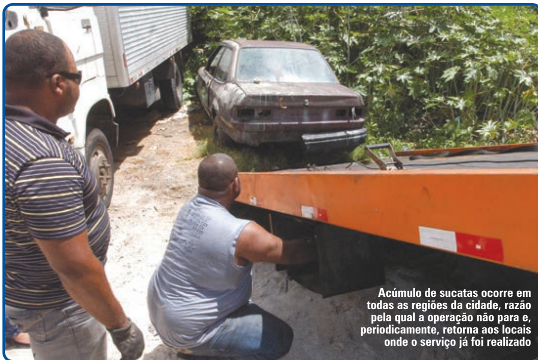
Acúmulo de sucatas ocorre em todas as regiões da cidade, razão pela qual a operação não para e, periodicamente, retorna aos locais onde o serviço já foi realizado