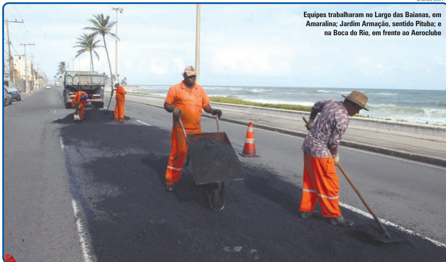
Equipes trabalharam no Largo das Baianas, em Amaralina; Jardim Armação, sentido Pituba; e na Boca do Rio, em frente ao Aeroclube