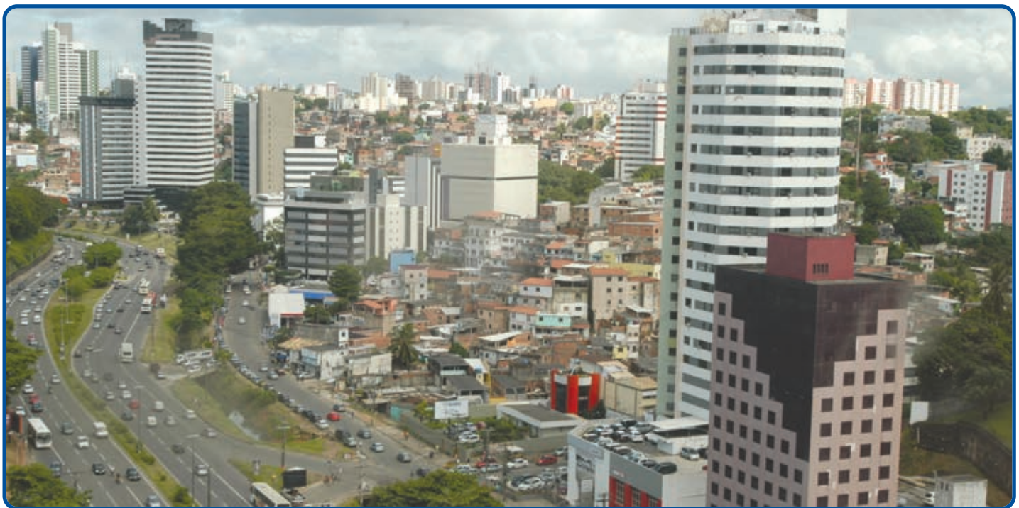
O corredor exclusivo trará melhoria da mobilidade nas avenidas Vasco da Gama, Juracy Magalhães e ACM, por onde o equipamento urbano passará

A presidente Dilma ressaltou o empenho da Prefeitura na execução de projetos voltados para a mobilidade da capital baiana, que será influenciada positivamente também com a construção do sistema metroviário, viabilizado apenas no início deste ano, após entendimento entre governo estadual e as prefeituras de Salvador e Lauro de Freitas. “Sei que o governador e o prefeito trabalharão no sentido de garantir essas obras. Chegou-se, aqui na Bahia, num momento em que se criaram as condições para que esses projetos fossem executados. Obras dessa grandeza exigem, sobretudo, vontade política”, arrematou.