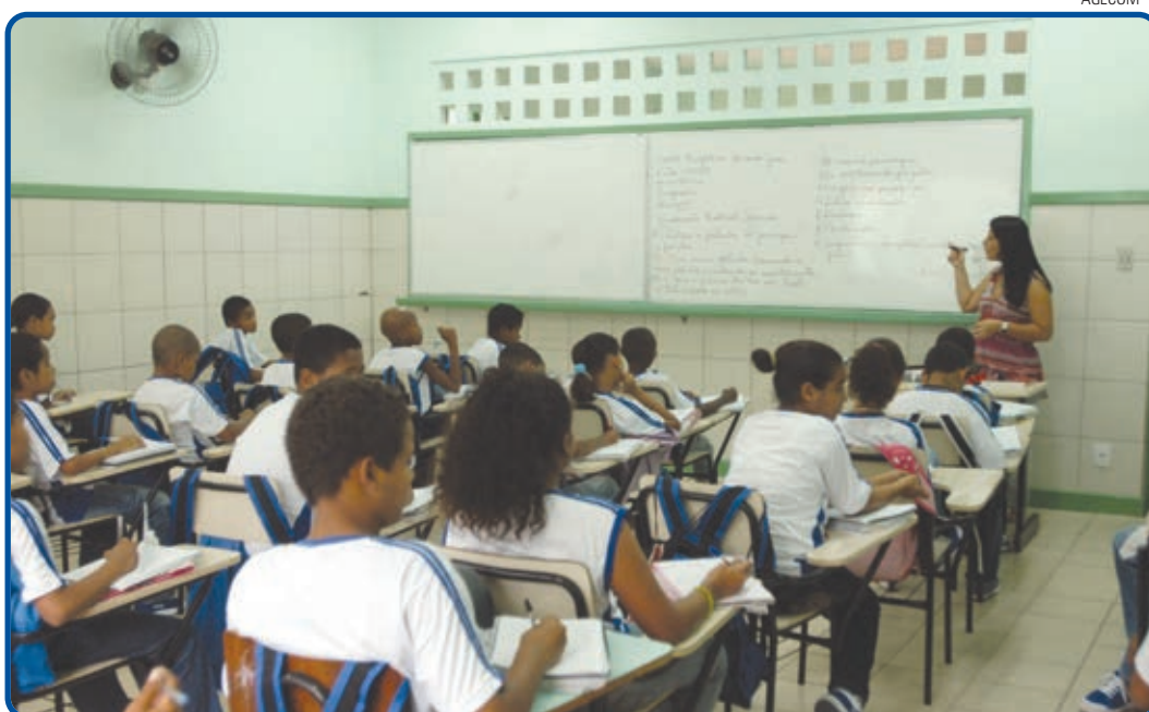
Entre as metas estão alfabetização de 70% das crianças até os seis anos e garantir quadro completo de professores