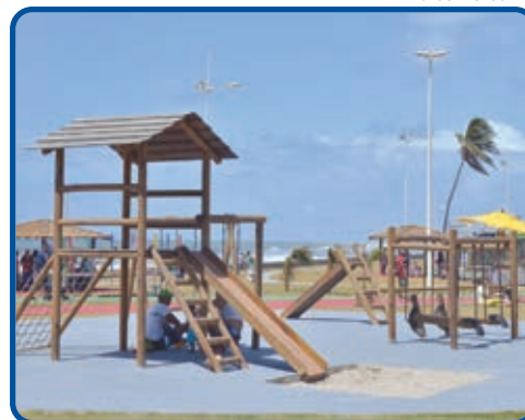
A área, de 80 mil m 2 , ganhou os mais variados equipamentos destinados à prática de esporte e ao lazer de adultos e crianças