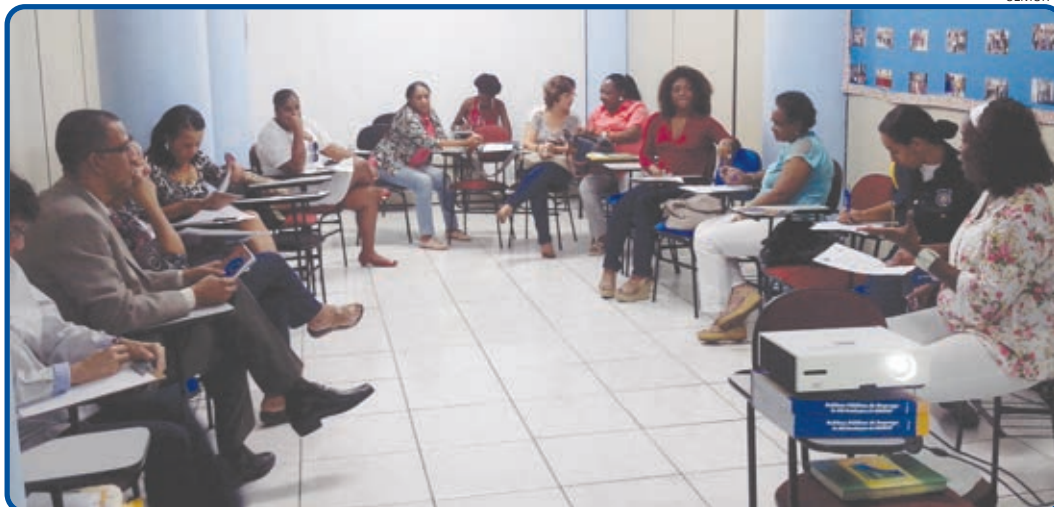
Encontro discutiu ações para o Novembro Negro, qualificação sobre temáticas étnicas e raciais dos órgãos

A ação tem como finalidade envolver todas as secretarias, com o intuito de atender ao modelo de gestão atual voltado ao respeito à diversidade racial. O racismo nas instituições pode ser visto ou detectado em processos, atitudes ou comportamentos que denotam discriminação resultante de preconceito inconsciente, ignorância, falta de atenção ou de estereótipos racistas que colocam minorias étnicas em desvantagem. Este tipo de comportamento impede o acesso adequado da população negra aos bens e serviços públicos, ampliando ainda mais as desigualdades sociais e raciais.