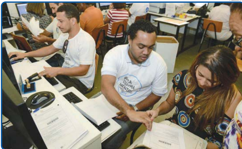
Os mutirões vão se intensificar. Uma van itinerante estará circulando nos bairros com técnicos da Sefaz

O cadastramento imobiliário não tem qualquer objetivo arrecada-