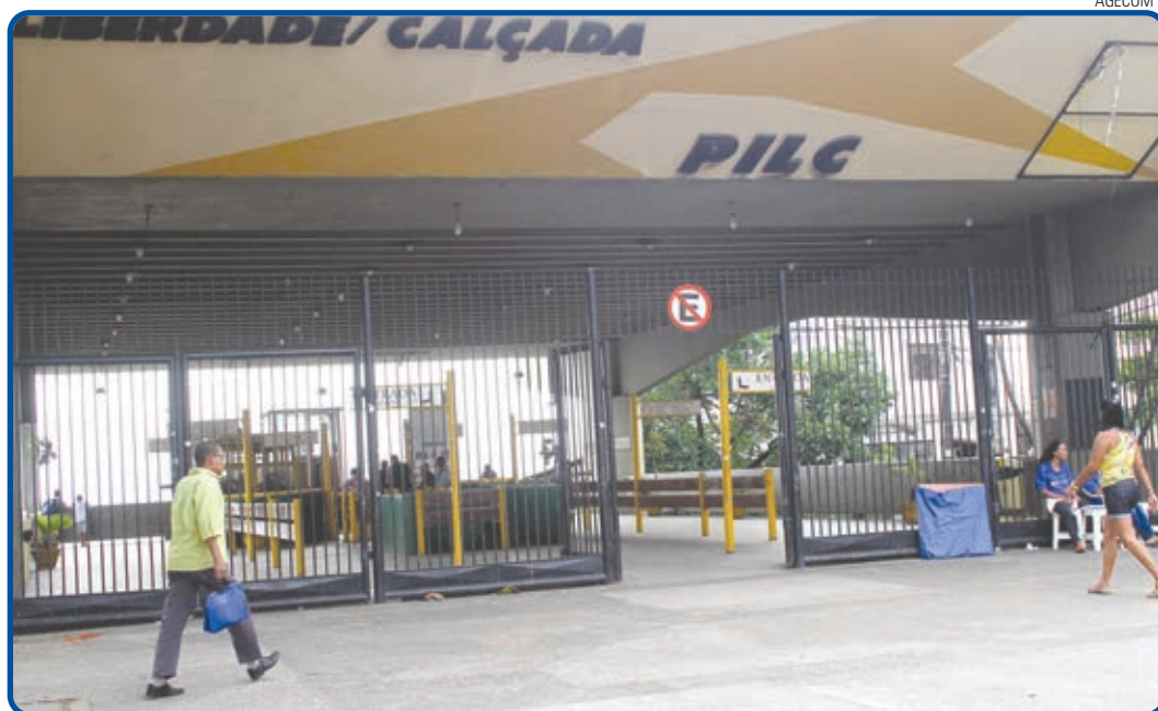
Fechado há 22 meses, a Prefeitura fez licitação para aquisição de dois bondes para o Plano Liberdade-Calçada