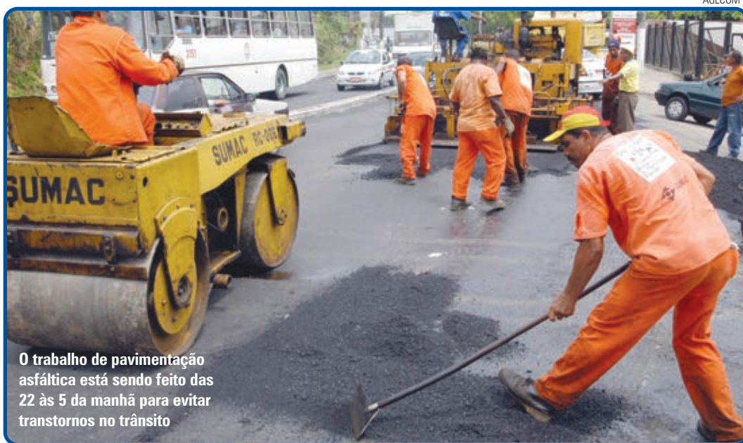
O trabalho de pavimentação asfáltica está sendo feito das 22 às 5 da manhã para evitar transtornos no trânsito

dão Vilela, São Rafael, Centenário, Luiz Tarquínio, Aliomar Baleeiro (Estrada Velha do Aeroporto), Almirante Tamandaré, Vale do Tororó, Estrada da Paciência, Rua Direta da Caixa D'Água e Estrada das Barreiras.