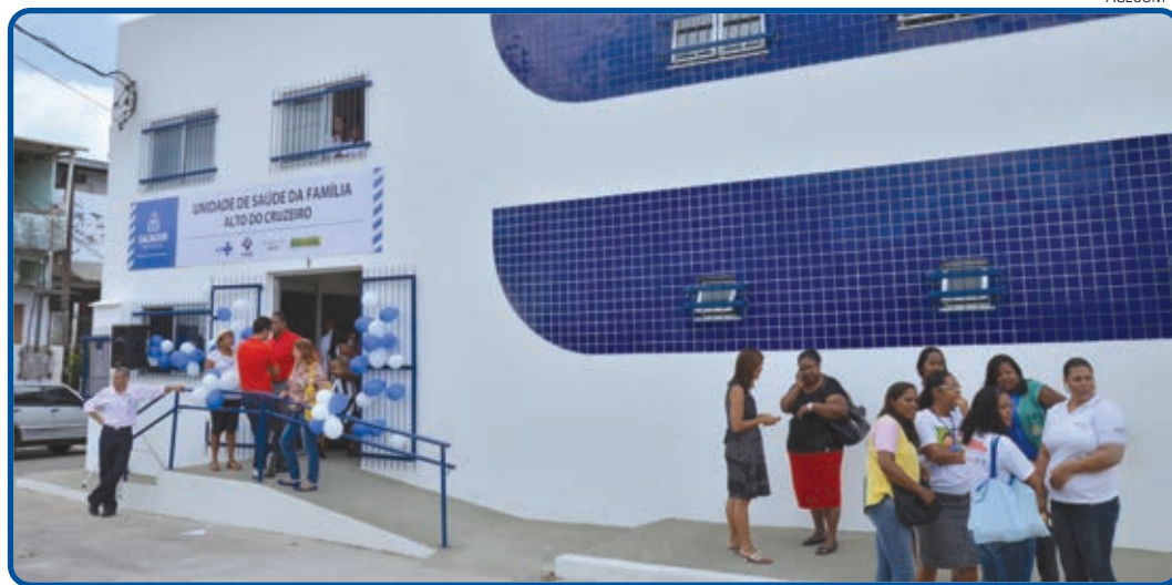
Esta semana a Prefeitura já entregou três USFs totalmente recuperadas aos moradores do Subúrbio Ferroviário