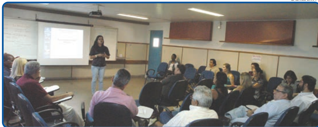
No curso, foram apresentados o trabalho de atenção básica nas unidades e o mapa das regiões contempladas