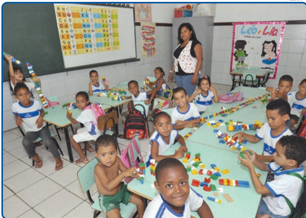
A comitiva esteve na Escola do Calabetão, onde estudam 327 alunos. Está programada uma vistoria no local