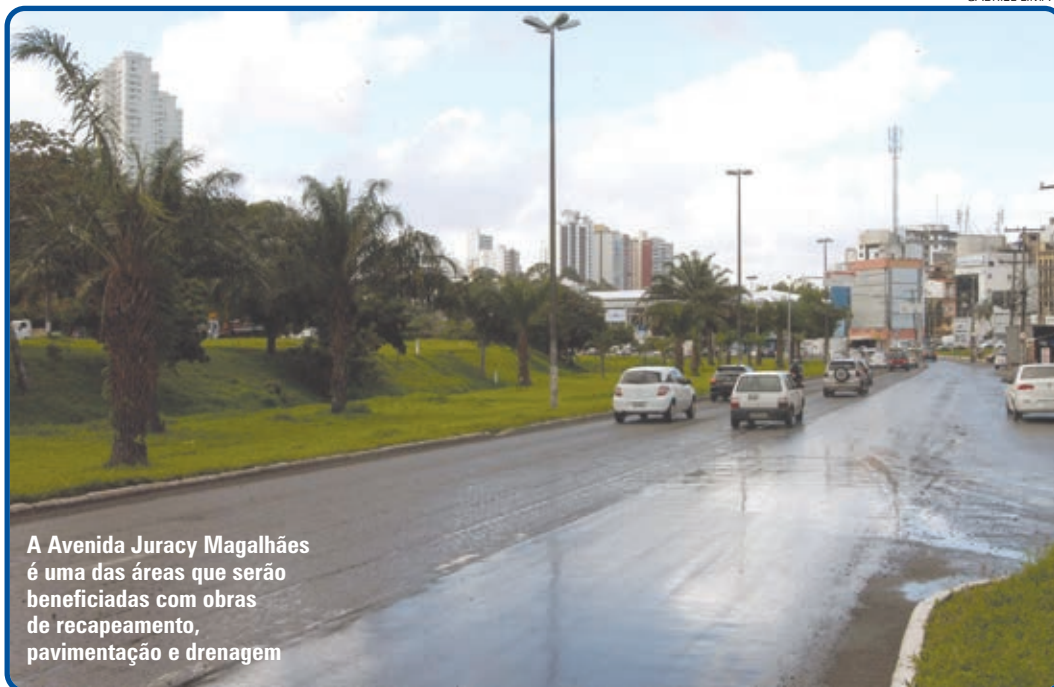
A Avenida Juracy Magalhães é uma das áreas que serão beneficiadas com obras de recapeamento, pavimentação e drenagem