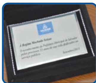
A servidora disse que dedicou sua vida ao serviço público, onde casou, nasceram seus filhos e netos e ficou viúva

Em um rápido discurso, a servidora afirmou que dedicou sua vida ao serviço público. “A minha história está aqui (Prefeitura). Na Prefeitura eu me casei, nasceram meus filhos e netos e fiquei viúva. Agora, quero aproveitar a aposentadoria para fazer muitas viagens”, afirmou.