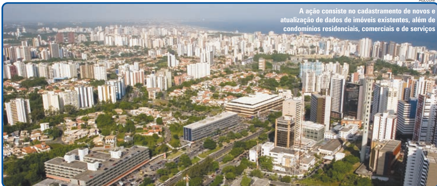
A ação consiste no cadastramento de novos e atualização de dados de imóveis existentes, além de condomínios residenciais, comerciais e de serviços