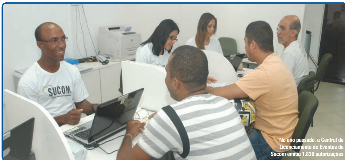
No ano passado, a Central de Licenciamento de Eventos da Sucom emitiu 1.836 autorizações