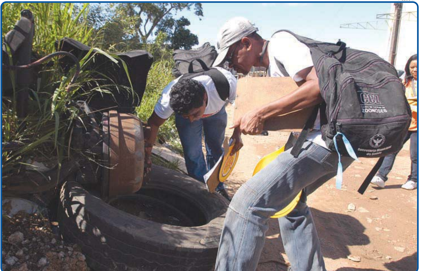
Coleta de materiais inservíveis, controle de foco do mosquito e sensibilização da comunidade para o descarte de tudo que acumule água fizeram parte da ação