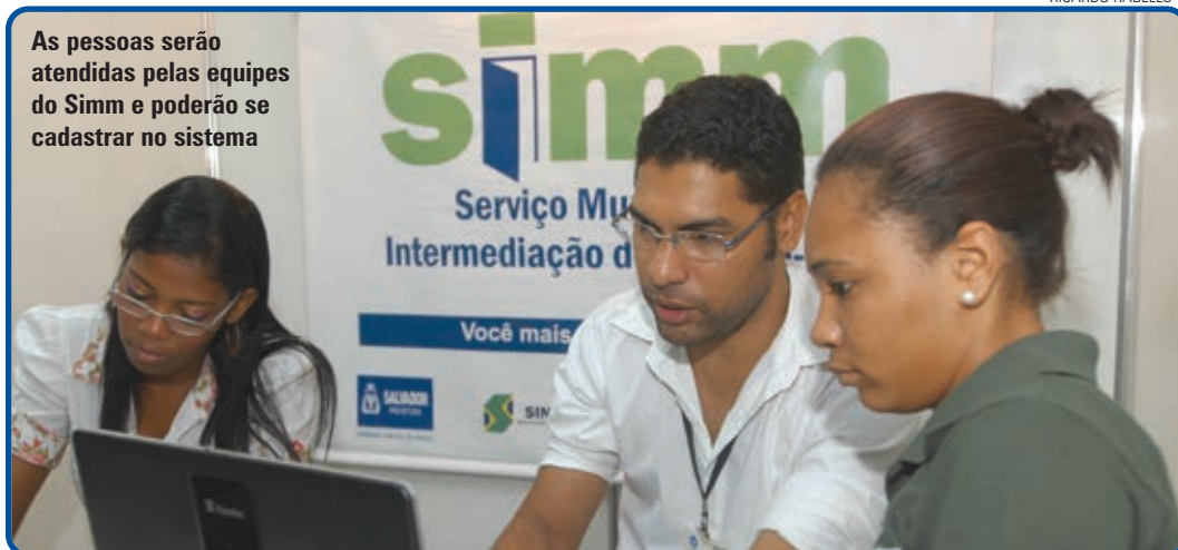
As pessoas serão atendidas pelas equipes do Simm e poderão se cadastrar no sistema