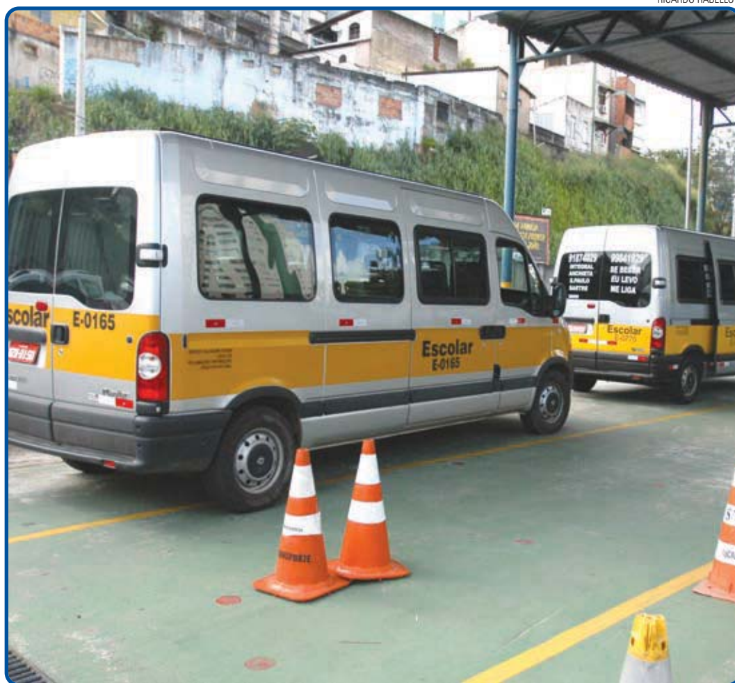
A Transalvador espera vistoriar, até o próximo dia 19, cerca de 800 veículos de transporte escolar da capital