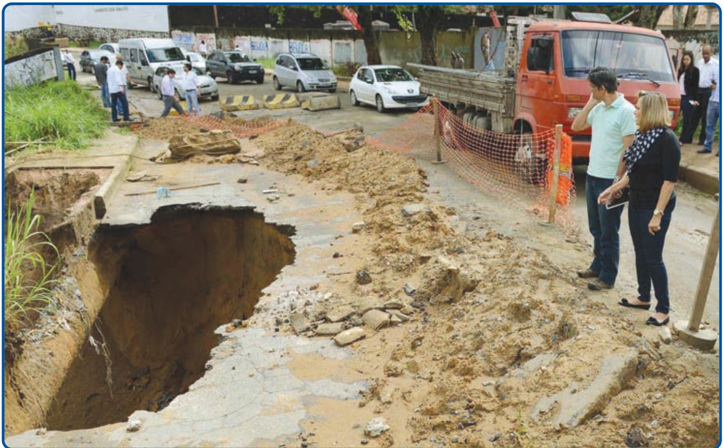
Na Estrada Velha do Aeroporto um deslizamento de terra forçou a interdição de uma das vias, próximo do Convento Dom Amado, no acesso ao Barradão