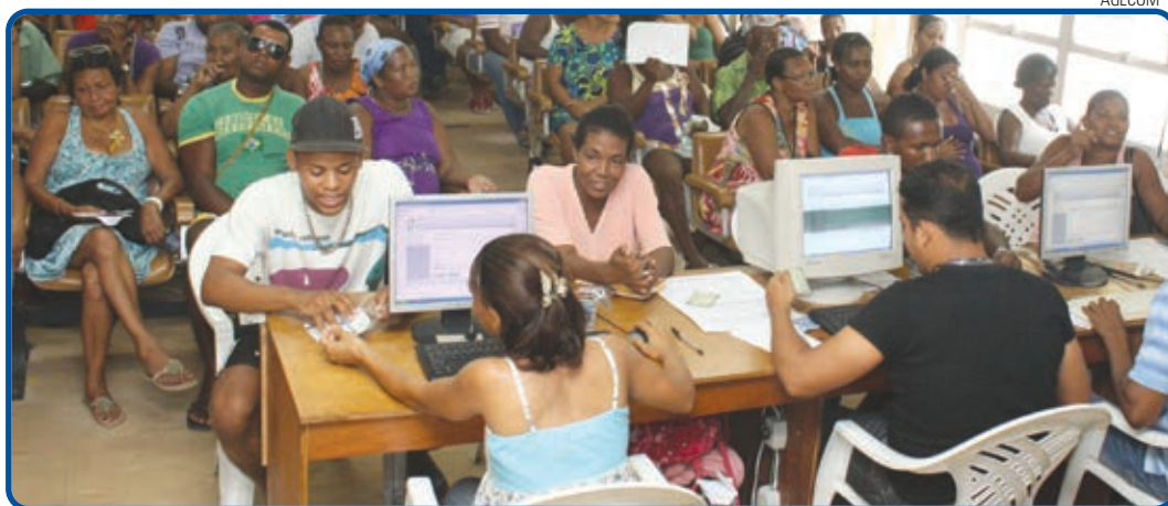
Os interessados devem se dirigir ao posto da Semop, onde pagarão a taxa de R$ 58 e receberão os isopores