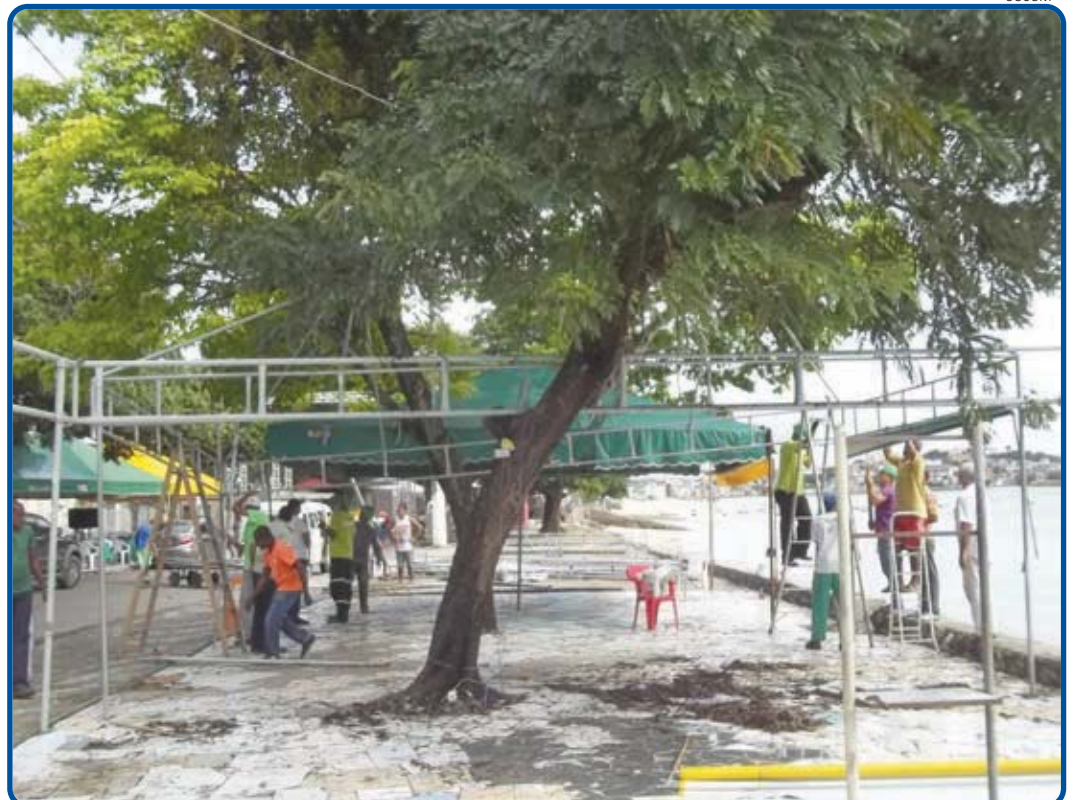
A instalação de equipamentos em caráter transitório ou permanente em áreas públicas só é permitida com alvará

A operação também segue o Artigo 169 do Código de Polícia Administrativa do Município do Salvador, que diz: “A utilização do logradouro público, em caráter transitório ou permanente, para instalação de equipamentos diversos, dependerá de Alvará da Prefeitura”.