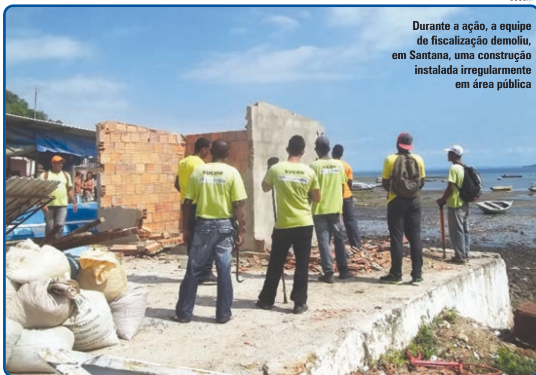
Durante a ação, a equipe de fiscalização demoliu, em Santana, uma construção instalada irregularmente em área pública