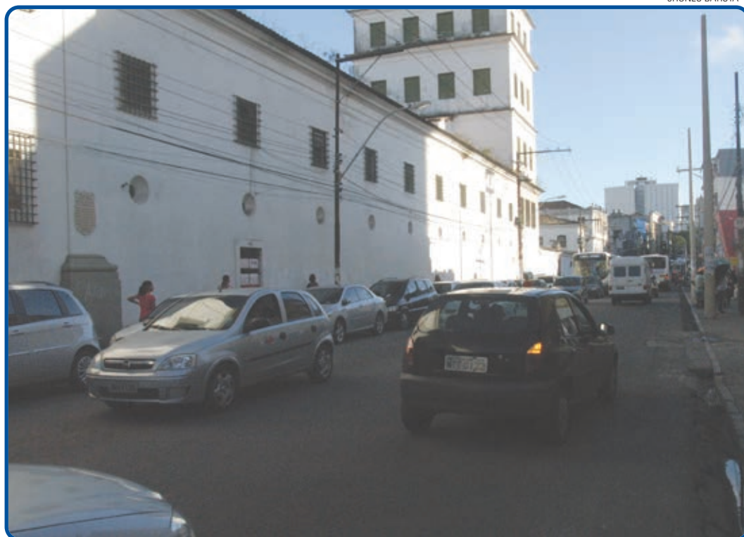
As medidas prevêem também modificações em áreas do Centro, a exemplo da Avenida Joana Angélica e Rua Chile