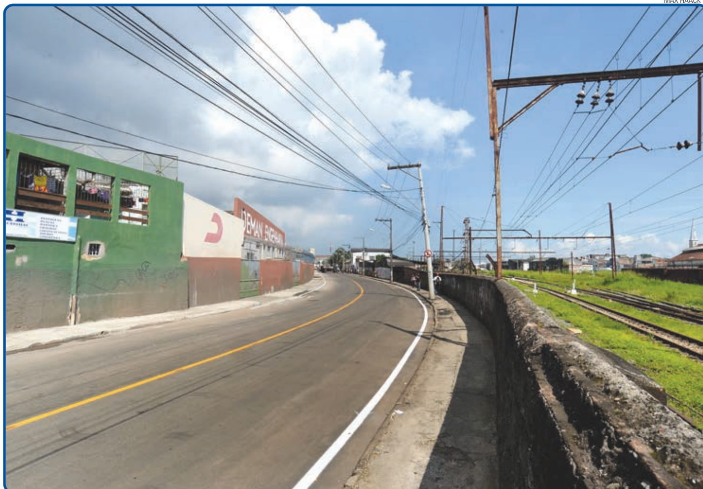
A imagem dominada por buracos e alagamentos deu lugar a uma via totalmente asfaltada e com condições normais para o tráfego de veículos