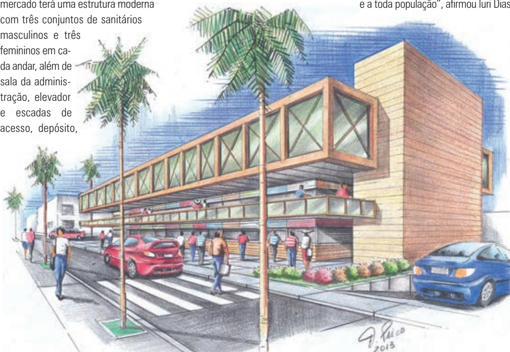
Pelo projeto, feito pela FMLF, o futuro estabelecimento ocupará uma área de 2.275 metros quadrados