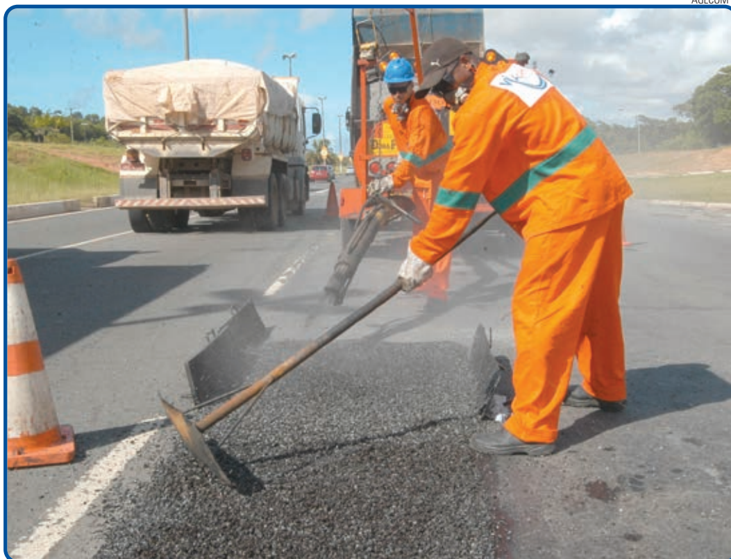
Ação está acontecendo em diversos bairros e avenidas de vale, com o objetivo de reduzir os transtornos

No caso da Paralela, a expectativa é que os trabalhos sejam finalizados até a próxima semana. Atualmente, 14 equipes realizam a operação, número que deve ser ampliado para 20 até o mês de junho. São cerca de R$ 15 milhões para tapa-buraco e outros R$ 17 milhões para recuperação total da malha viária. Desse montante, R$ 6 milhões já estão liberados.