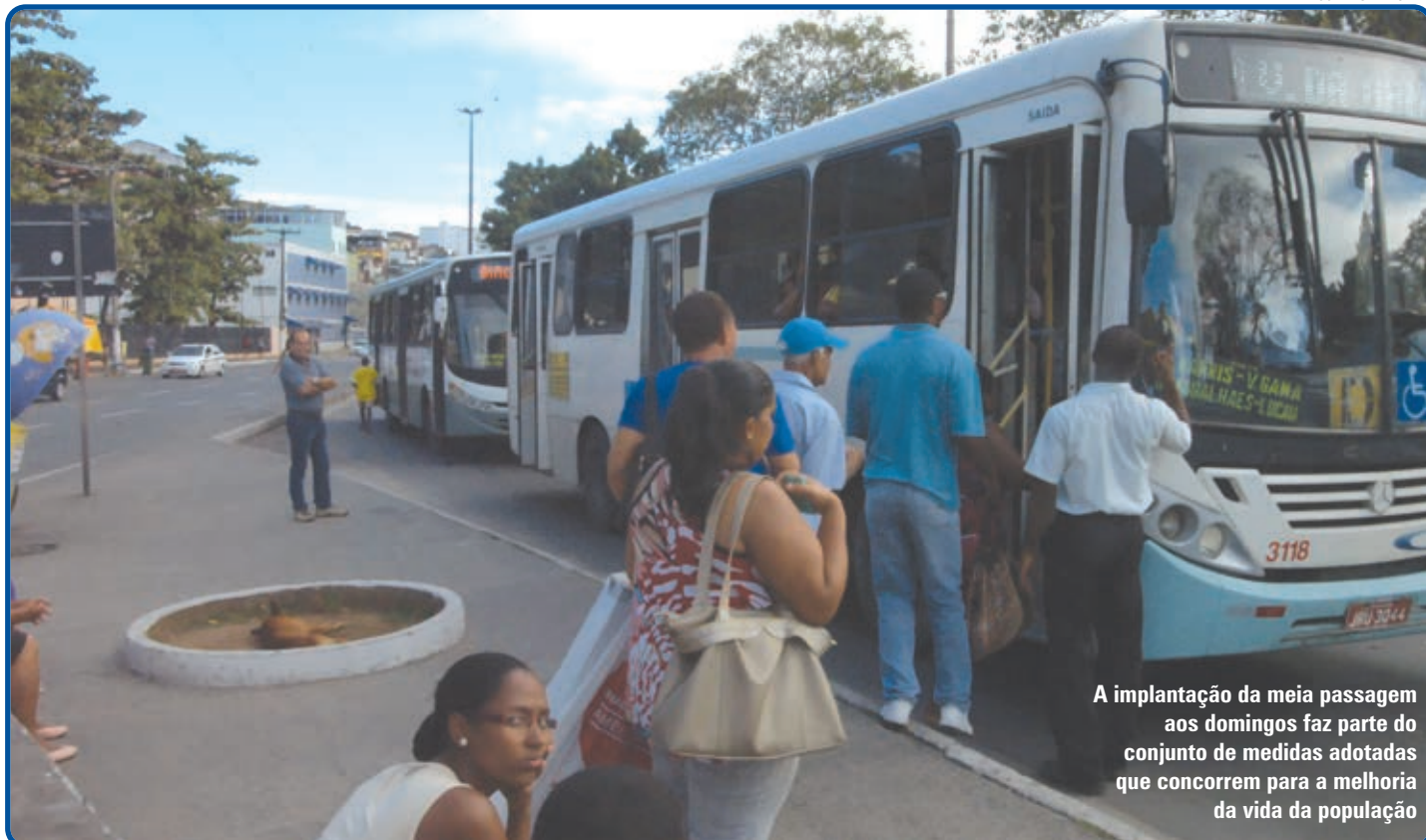
A implantação da meia passagem aos domingos faz parte do conjunto de medidas adotadas que concorrem para a melhoria da vida da população