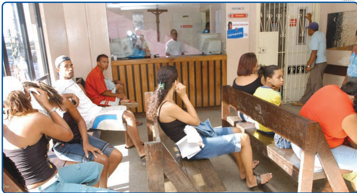
A reforma dos postos de saúde garantirá condições dignas de trabalho e atendimento tanto aos profissionais como para os usuários do SUS