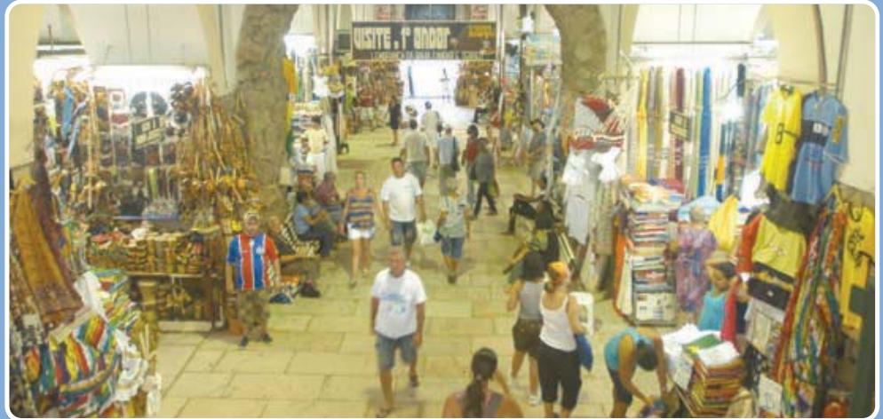
As intervenções físicas vão melhorar as estruturas do centro comercial, que ganhará também um espaço cultural

As demais etapas estão sendo executadas por técnicos da Empresa Salvador Turismo (Saltur), órgão ligado à secretaria, através de pesquisas, análises e estudo de viabilidade de projetos para melhoramento e organização da área.