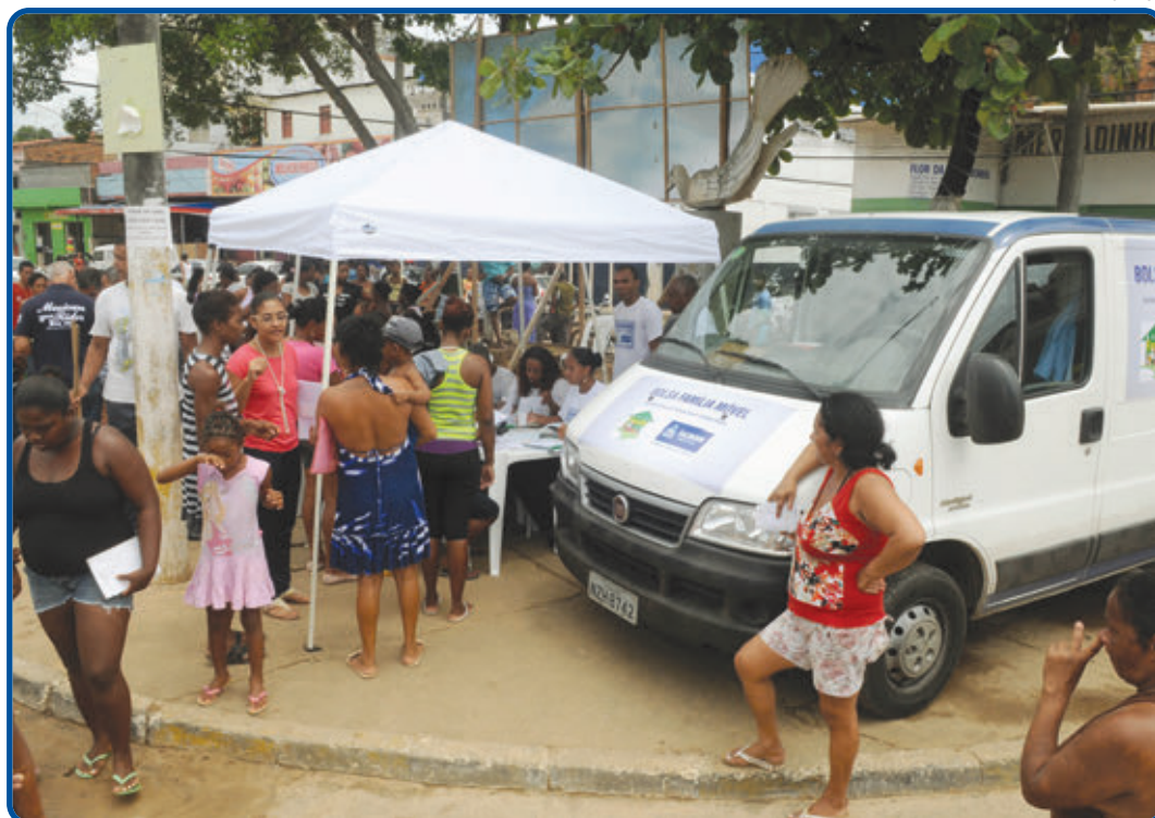
A ação começou na semana passada, no Bairro da Paz, onde centenas de pessoas foram atendidas