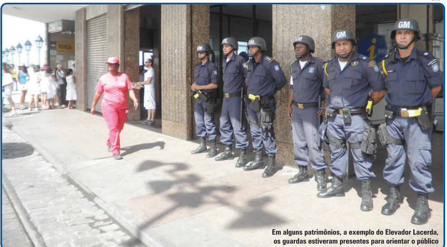
Em alguns patrimônios, a exemplo do Elevador Lacerda, os guardas estiveram presentes para orientar o público