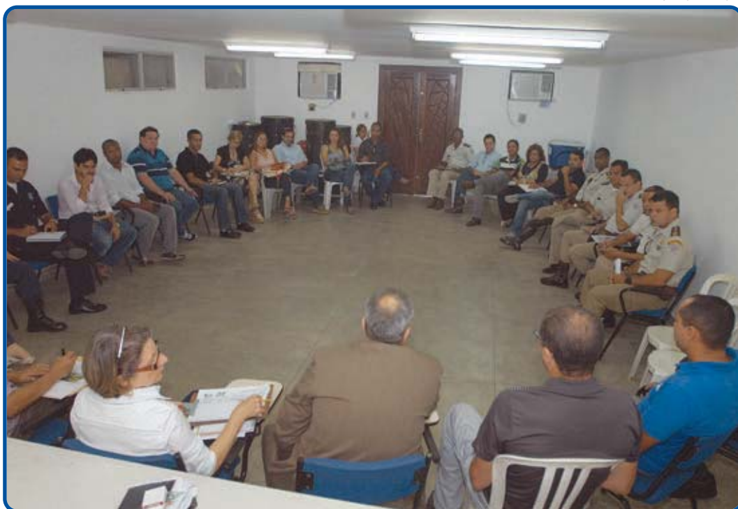
Encontro, realizado na manhã de ontem, aconteceu na sede da Saltur, responsável pela coordenação da festa