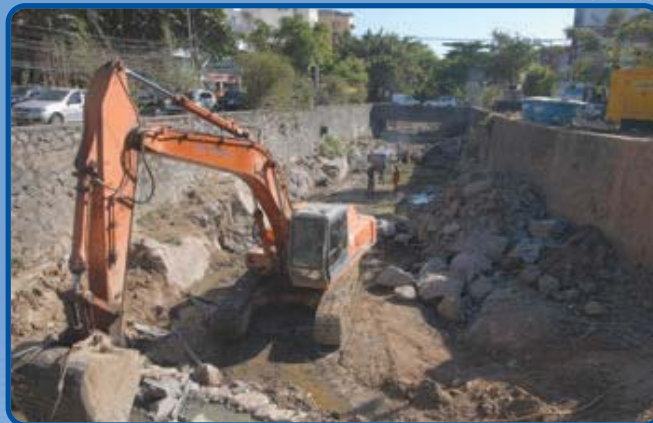
As obras realizadas no fundo das galerias do canal do Lucaia, que integram o conjunto de intervenções na Vasco da Gama, facilitarão o escoamento da água e acabarão com o mau cheiro na região