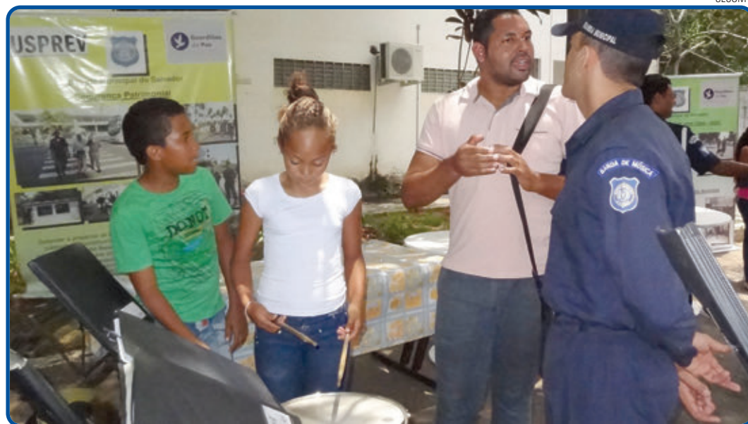
O Guardiões da Paz promove interação por meio da realização de palestras, campanhas e projetos sociais