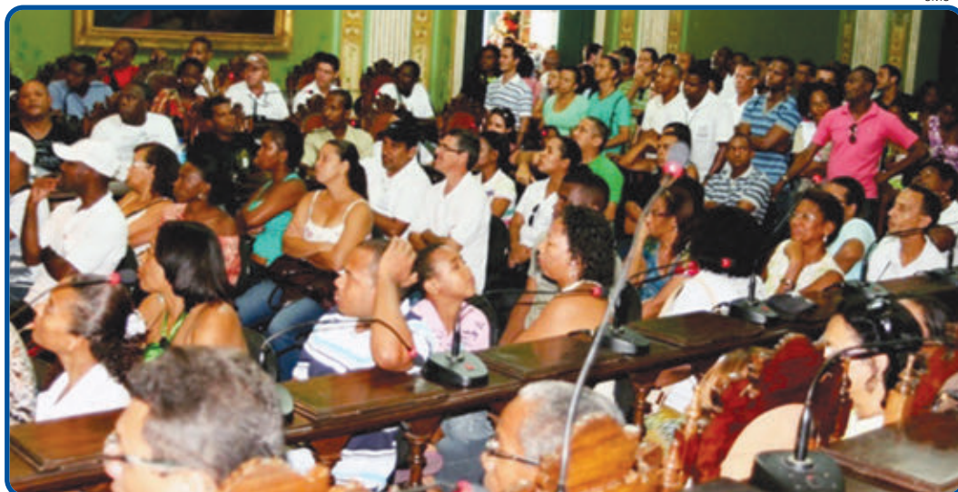
Representantes da categoria lotaram a casa legislativa, em solenidade realizada na manhã da última segunda-feira