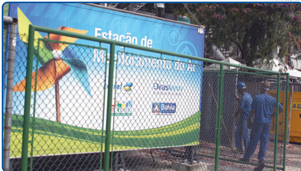
Salvador é a primeira capital no país a contar com uma Rede Automática de Monitoramento da Qualidade do Ar

Atualmente, existem também estações localizadas em pontos estratégicos da Avenida Paralela, Campo Grande, Dique do Tororó, Rio Vermelho e Pirajá. Três novas unidades serão ins-