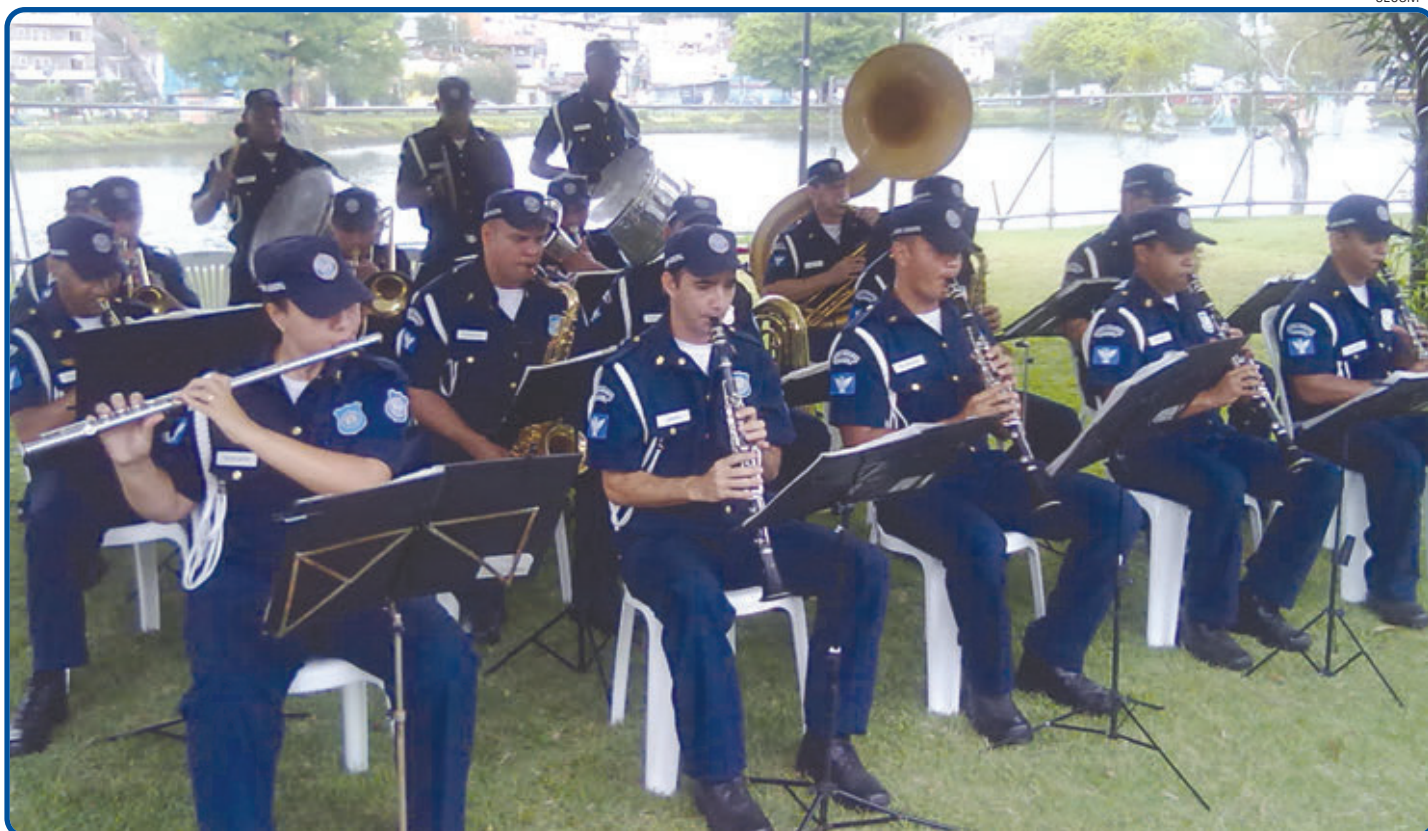
Além do trabalho desenvolvido nas ruas, agentes da Guarda Municipal se destacam na orquestra, levando música de qualidade a diversos eventos