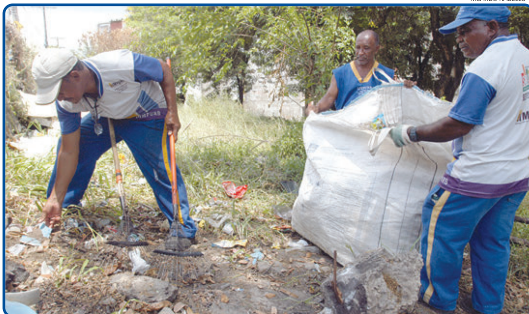
Ação, que tem como foco a proteção do meio ambiente, começou ontem e prossegue até amanhã, no Setor C

Para o mutirão, a Limpurb disponibilizou 14 agentes de limpeza, além de um caminhão para a coleta dos resíduos. “Estamos contando ainda com uma equipe de conscientização ambiental que, além de divulgar o horário de coleta da região, também tem dado dicas aos moradores sobre como descartar o lixo de maneira correta”, completou Pereira. Em Mussurunga, a coleta ocorre de segunda a sábado, sempre a partir das 18 horas.