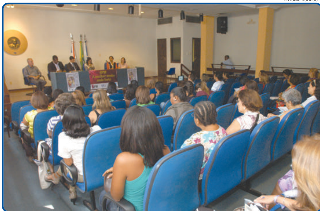
Iniciativa visa a promoção da igualdade de gêneros, abordando formas de violência enfrentadas pelas mulheres