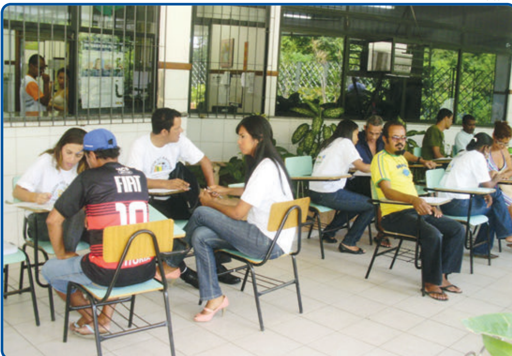
A iniciativa objetiva descentralizar os serviços prestados na sede da autarquia e oferecer comodidade à população