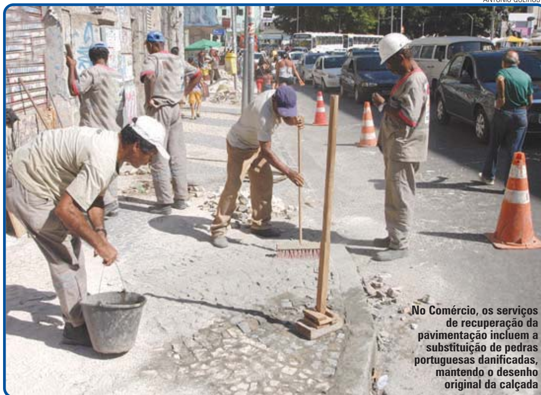
No Comércio, os serviços de recuperação da pavimentação incluem a substituição de pedras portuguesas danificadas, mantendo o desenho original da calçada