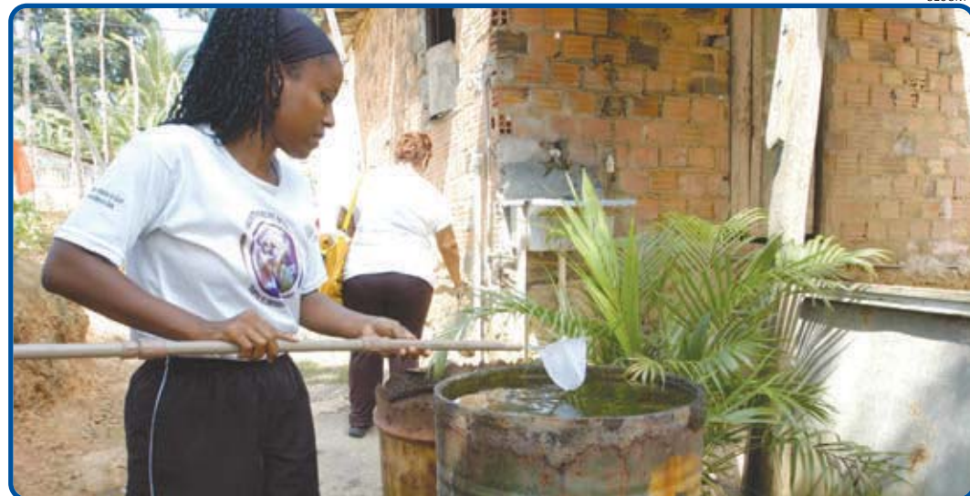
Mesmo com os resultados alcançados, a Prefeitura intensificará os trabalhos de combate ao Aedes aegypti

Os profissionais de imprensa, locais, nacionais e estrangeiros, já começaram a se credenciar para a cobertura do Carnaval 2013. O credenciamento, que começou no dia 19 de novembro, pela Secretaria Municipal de Comunicação, pode ser realizado pelos veículos de comunicação, pelos jornalistas dos órgãos ou por profissio-