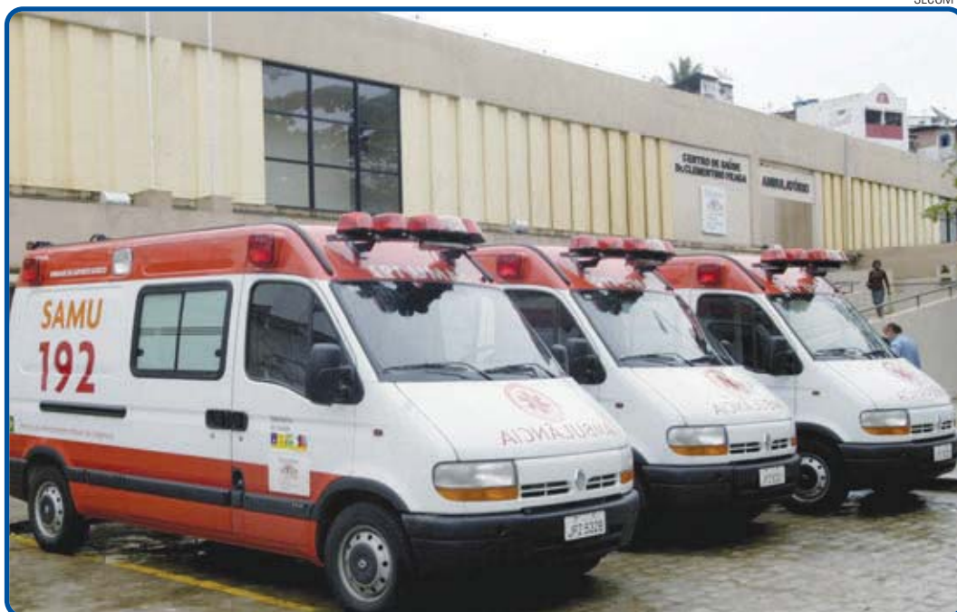
Psiquiatra, ortopedista, enfermeira e técnicos em enfermagem fazem parte da equipe que visitará unidades do Samu