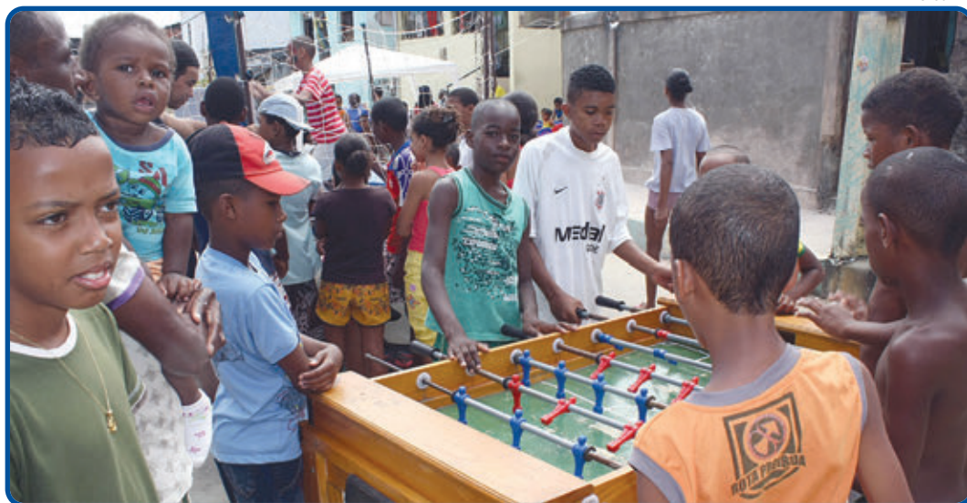
Uma das atrações mais apreciadas nas comunidades, o projeto Ruas de Lazer promove jogos e brincadeiras