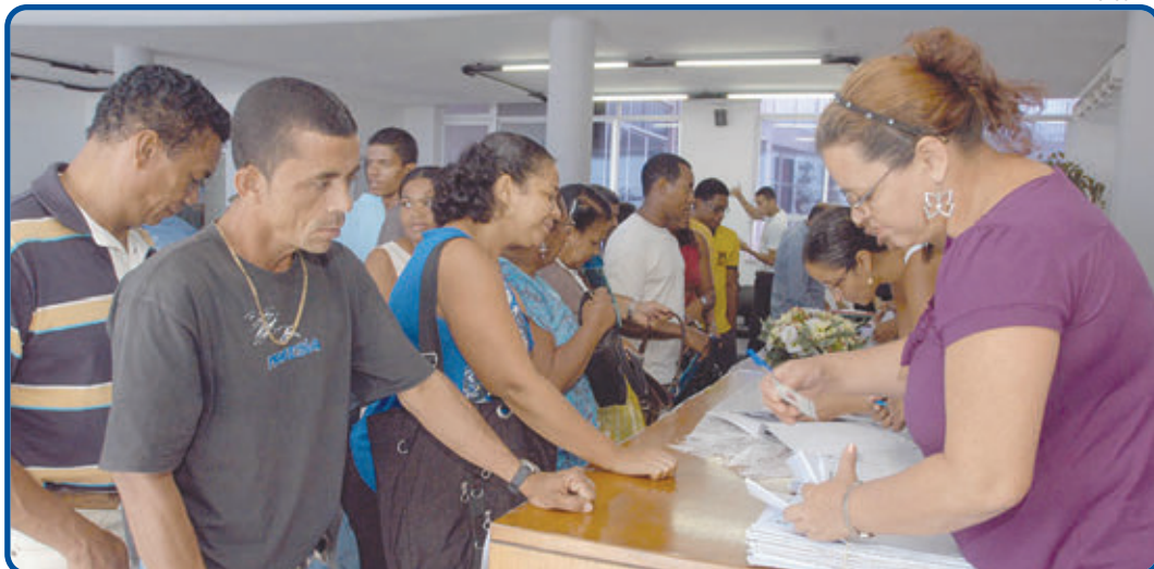
Para se habilitar, é preciso que a área do imóvel tenha até 250 m 2 , pertença ao município e esteja em área urbana

Com base nos dados da Sedham, as áreas de maior concentração de títulos concedidos ficam na Chapada do Rio Vermelho e entorno, Bairro da Paz, Avenida Suburbana, Fazenda Grande do Retiro e São Cristóvão. Além de regularização de