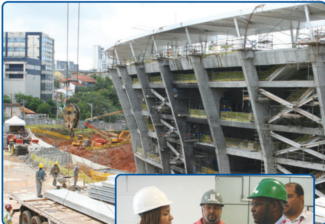
Os técnicos inspecionaram a obra, observando uso dos equipamentos de segurança

De acordo com dados do Ministério da Previdência, mais de um tra-