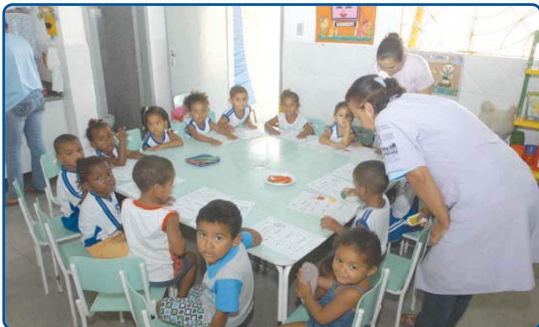
A Secult acolheu este ano 1.796 crianças nos Cmeis, onde elas recebem cuidados, alimentação e ações educativas