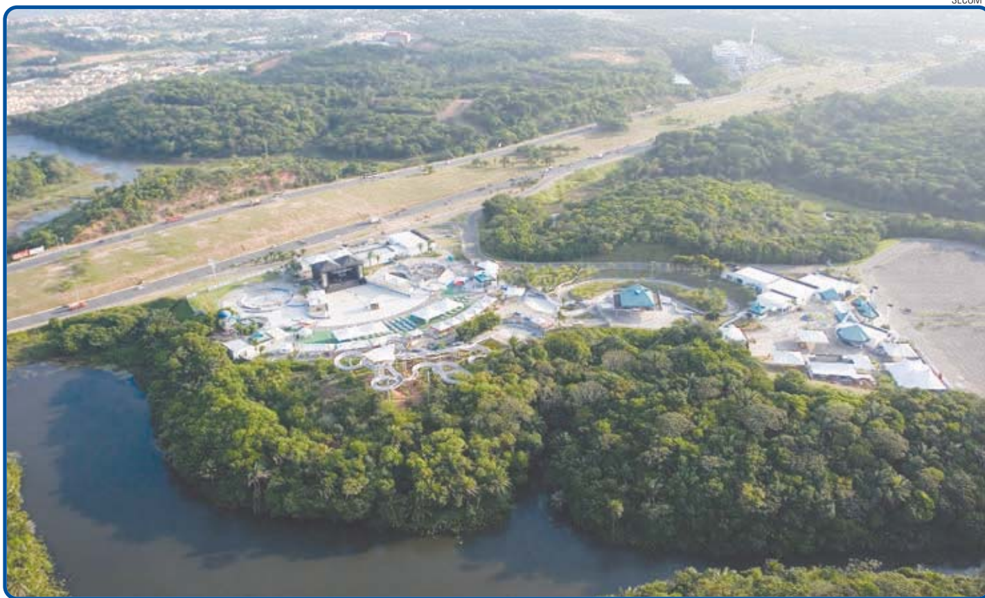
Numa área de 682,8 mil metros quadrados será implantada a Avenida da Paz, entre a Paralela e a Av. Orlando Gomes, margeando o Bairro da Paz