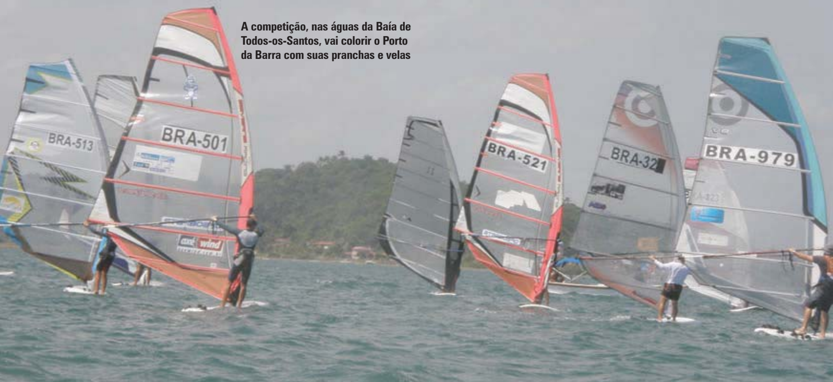
A competição, nas águas da Baía de Todos-os-Santos, vai colorir o Porto da Barra com suas pranchas e velas

A Superintendência de Trânsito e Transporte (Transalvador) também foi mobilizada para orientar os motoristas que trafegam no local, no sentido de evitar congestionamentos. As equipes da Empresa de Limpeza Urbana de Salvador (Limpurb) vão atuar na limpeza da região do Porto da Barra, e a Guarda Municipal estará presente no apoio às ações da Sesp e na segurança do patrimônio público.