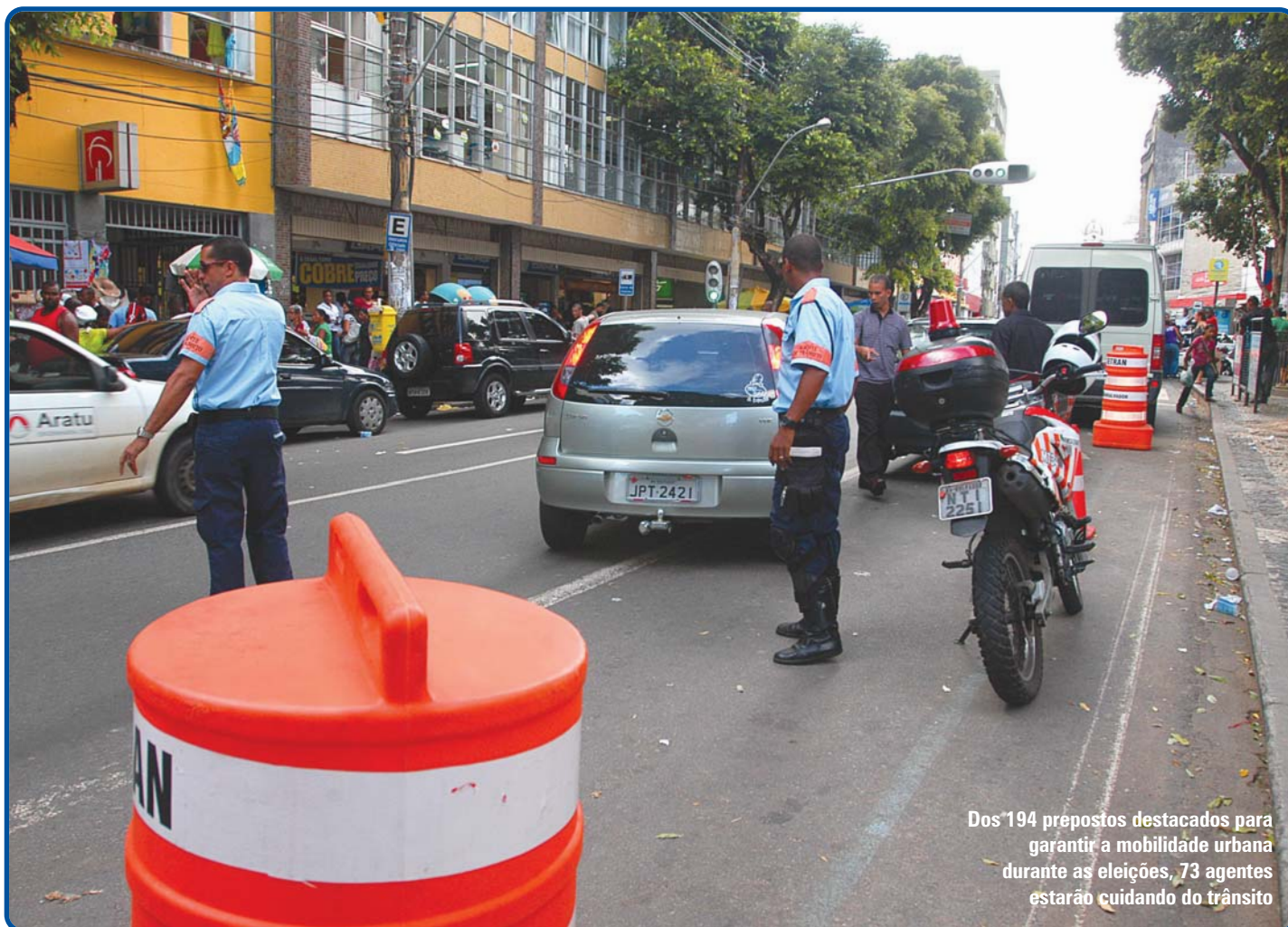
Dos 194 prepostos destacados para garantir a mobilidade urbana durante as eleições, 73 agentes estarão cuidando do trânsito