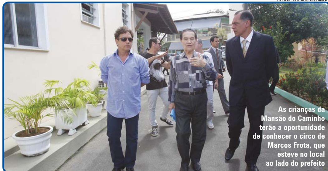
As crianças da Mansão do Caminho terão a oportunidade de conhecer o circo de Marcos Frota, que esteve no local ao lado do prefeito

Durante a visita à Mansão do Caminho, o ator Marcos Frota informou que também levará espetáculos circenses à instituição, para apresentar às crianças menores de cinco anos, que não poderão ir ao circo. Frota aproveitou a ocasião para destacar a importância do trabalho