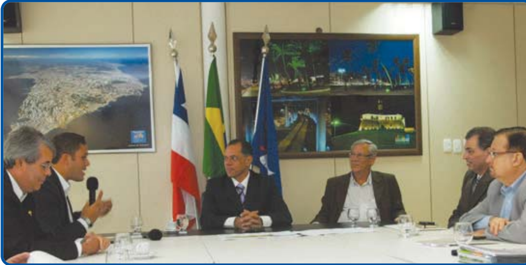
O presidente do Bahia, Marcelo Guimarães Filho, falou na cerimônia parabenizando a Prefeitura pela intervenção

Durante a solenidade, o prefeito destacou que a intervenção promoverá mais uma opção de lazer e conforto aos soteropolitanos. “Esta é mais uma ferida urbana que enfrentamos, ao longo dos últimos oito anos. Do mesmo modo que transformamos espaços como a Centenário, o Imbuí, a antiga fábrica da Barreto de Araújo, na Ribeira, o clube Português, na Pituba, entre outros 650 locais em áreas de lazer e convivência, estamos agora dando mais um passo para transformar