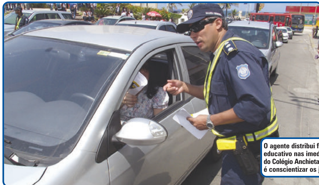
O agente distribui folheto educativo nas imediações do Colégio Anchieta. O foco é conscientizar os jovens

A ação agradeceu aos pais e alunos da instituição que diariamente frequentam o local. “Aqui é muito movimentado neste horário; o cuidado com todos é louvável”, afirmou a or-