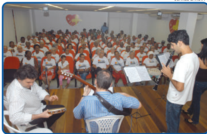
Janela Brasileira e Duo de Violão tocaram MPB, chorinhos e sambas